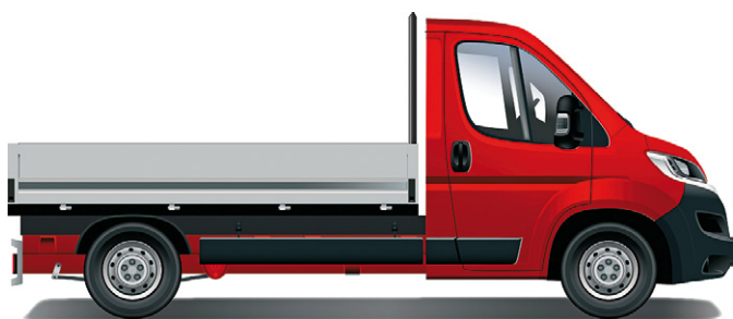
Citroën Jumper valník – jednoduchá kabína