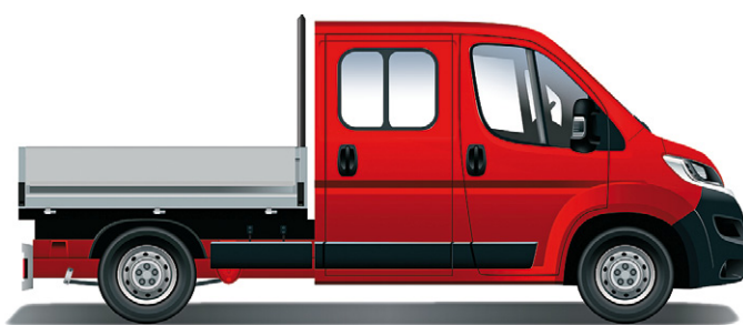
Citroën Jumper valník – dvojitá kabína